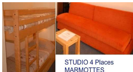
STUDIO 4 Places MARMOTTES

Séjour canapé lit 140 - 2 Places Coin montagne: lit superposés - 2 pers