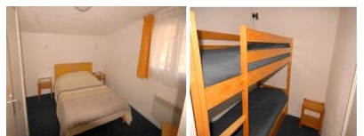
Appartement 2 pièces 6 places