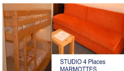
STUDIO 4 Places MARMOTTES

Séjour canapé lit 140 - 2 Places Coin montagne: lit superposés - 2 pers