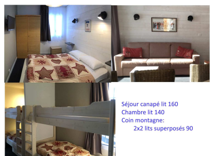
Séjour canapé lit 160 Chambre lit 140 Coin montagne: 2x2 lits superposés 90