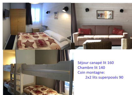
Séjour canapé lit 160 Chambre lit 140 Coin montagne: 2x2 lits superposés 90