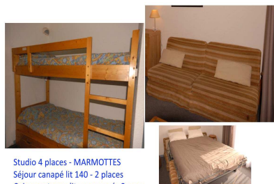
Studio 4 places - MARMOTTES Séjour canapé lit 140 - 2 places Coin montagne lit superposés 2 pers